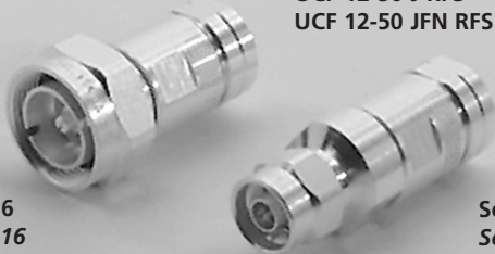
Serie 7-16 Series 7-16

für Kabel / for cable: G23 5092 1/2"-HiFLEX FSJ4-50B HFSC 12D LG HPL 50-1/2SF RFF 1/2"-50 SCF 12-50 J RFS SCF 12-50 JFN RFS UCF 12-50 J RFS UCF 12-50 JFN RFS