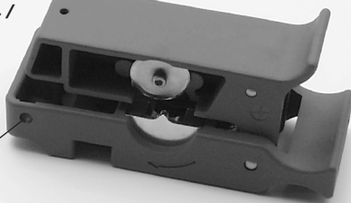
Anbindemöglichkeit Hole for tie-on

Feinjustierung (Schnitttiefe für Kabeltoleranzen. Vor-eingestellt auf Kabel RFF 1/2"-50 Fine adjustment (cutting depth) for cable tolerances. Pre-adjusted for cable RFF 1/2"-50